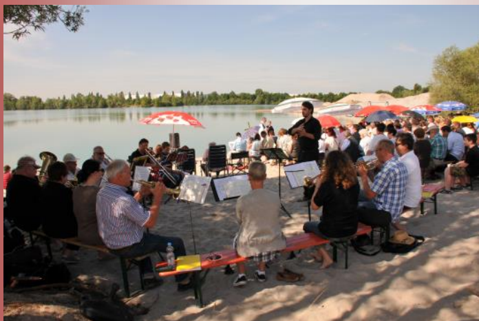
Gemeinsamer Taufgottesdienst der Kirchengemeinden Eich und Gimbshaim am 14.06.2015 am Pfarrwiesensee, den der Posaunenchor musikalisch begleitete